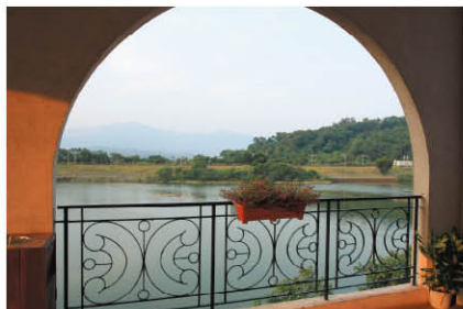
從互動中心眺望四週景色