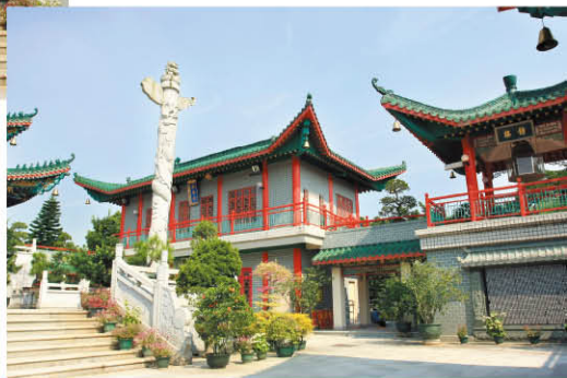
贊花宮兩旁的樓閣