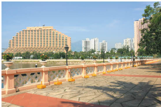
黃金海岸商場海旁長廊

商場提供完善配套設施，包括便利店、超級市場、洗衣店、拍照及理髮服務等。此外，座落海旁的戶外餐廳，包括各式各樣的泰國、法國、上海餐廳及咖啡店，供遊客選擇。