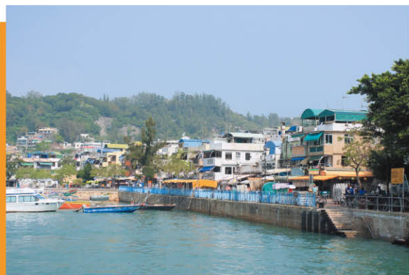
位於碼頭附近的海傍街 東堤海灘