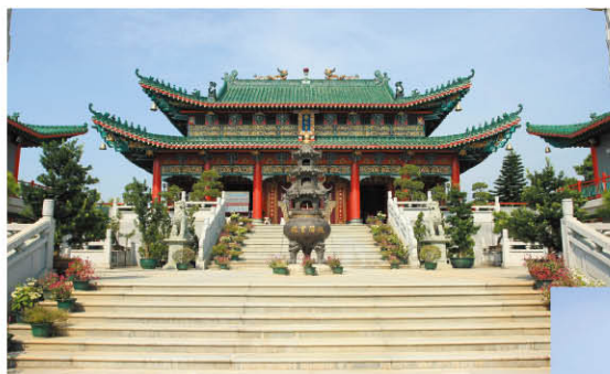
雲泉仙館內的贊花宮