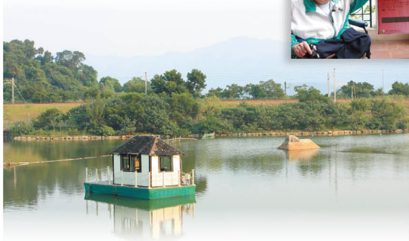
白鷺湖中的小白屋

人類在約二百萬年前已開始嘗試運用環境中的各種物料去輔助日常生活，隨著無數次的觀察和發現，逐步開始將這些物料進行加工，薪火相傳、經年累月地將技術累積和發展。最早期利用的物料除了獸骨、獸皮和石頭之外，更包括了木、草、動植物纖維、竹和泥土等，配以重力，風力、水力、離心力和槓桿等原理運作，成為今日科技發展的基石。