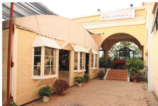
售賣特色手信的小賣部