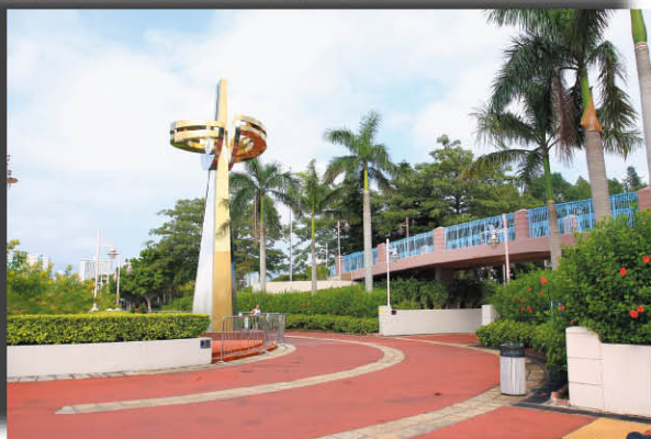
回歸十周年紀念雕塑