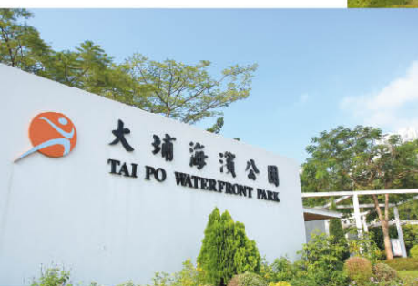
大埔海濱公園（大發街入口）