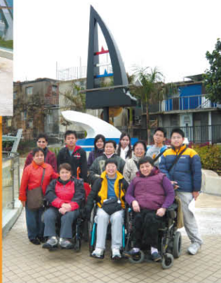
考察團 在景點留影